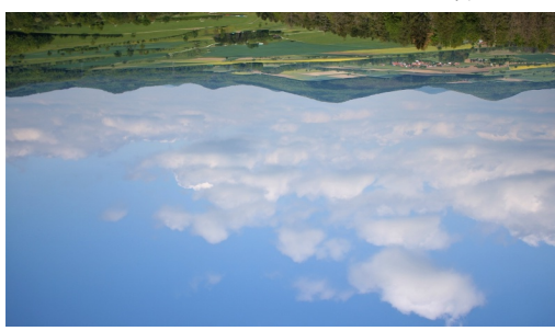
Extratour Weinberg