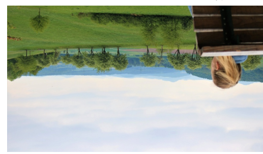
Extratour Weinberg