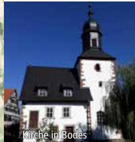
Kirche in Bodes