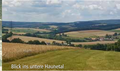
Blick ins untere Haunetal