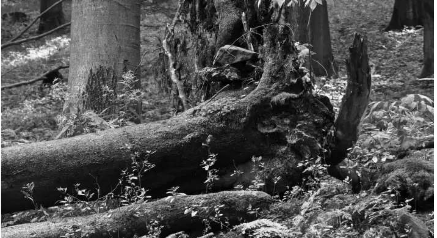
1 / 2 Totholz im Naturschutzgebiet

Die 18,3 km lange Tour beginnt am Parkplatz Stallberg und ist durch ein rotes „K“ auf weißem Grund markiert. Morsberg, Stallberg, Appels-, Rückers-, Klein- und Gehilfersberg sowie fünf weitere Bergkegel bilden das sogenannte Hessische Kegelspiel, durch das die Tour führt und das ihr den Namen gegeben hat.